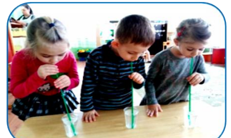
Ой, воздух пошёл

Опыты детей проводились совместно с воспитателем.