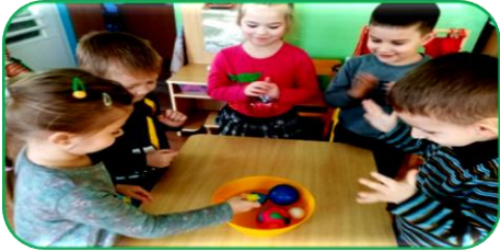
Опыт-игра «Тонет – не тонет»