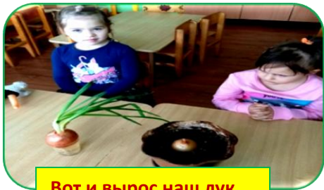
Вот и вырос наш лук

Опыты детей проводились совместно с воспитателем.