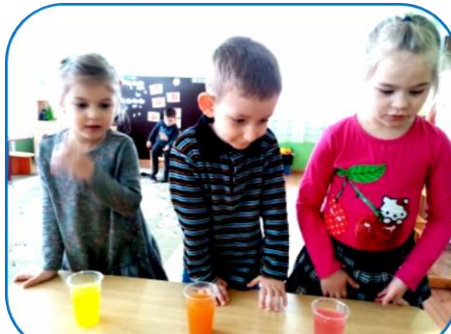
Опыт-игра «Разноцветная вода»