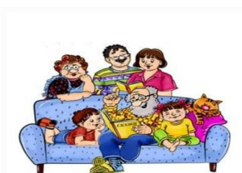
Традиции семейного чтения

Каждый ребенок имеет признание его как личности, любим и уважаем, только потому, что он есть. Коллектив детского сада- это коллектив,творящий развивающее пространство, направленное на воспитание свободной,творческой личности.